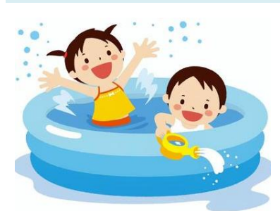
気持ちいい！夏の水遊び 楽しい“水遊び”