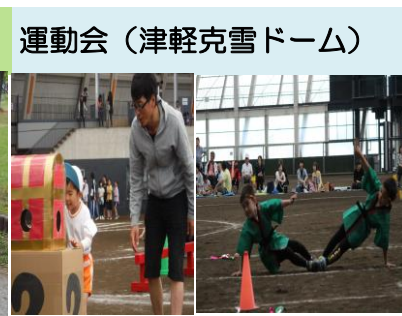
運動会（津軽克雪ドーム）