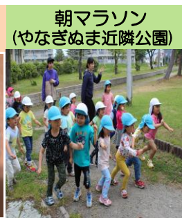
朝マラソン (やなぎぬま近隣公園)