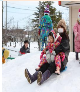
～シュー！園庭の雪山、最高！～ 冬は雪遊びで体カアップ！