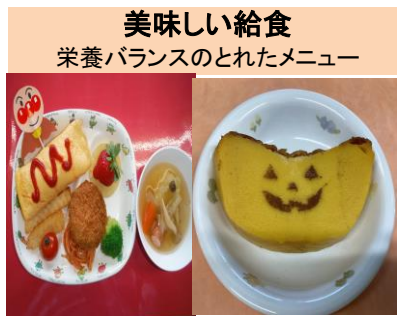
美味しい給食 栄養バランスのとれたメニュー